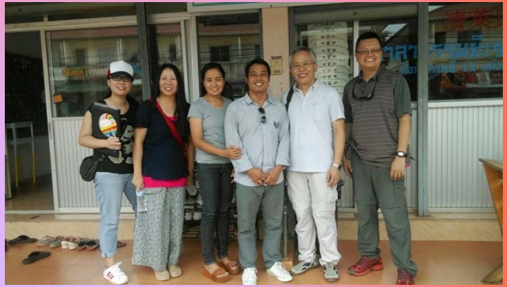
何超然傳道 (教會宿舍)